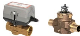
Válvulas para Fan&Coil