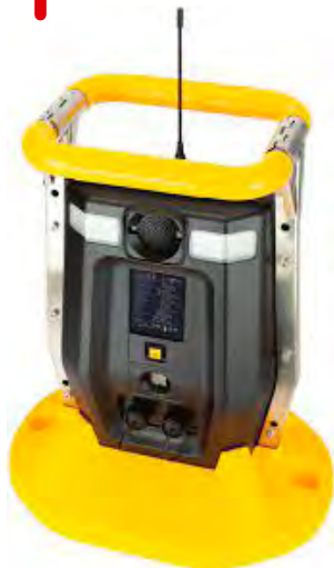
Monitor Detección de área portátil de multigases